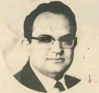
Η διαμάχη γύρω από το θέμα μεταφέρθηκε από τις πολύ πρώτες μέρες του διορισμού του

Όπως είναι γνωστό τόσο ο υπουργός παιδείας όσο και η εκπαιδευτική πολιτική που ακολουθεί αποτέλεσε τον στόχο των πιο αντιδραστικών δυνάμεων του τόπου, που επιθυμούν προσκόλληση στα «ελληνοχριστιανικά» ιδεώδη και επάνοδο στις σκοταδιστικές αντιλήψεις που επικρατούσαν στα σχολεία μας στην περασμένη δεκαετία.