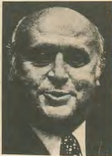
υποστήριξη και η ανοχή των αριστερών μαζών.

Βέβαια παρ' όλ' αυτά, τόσο η μια λύση όσο και η άλλη δεν μπορούν να αποτελούν για πολύ καιρό ακόμα εύκολη σχετικά διέξοδο, για την άρχουσα τάξη της Τουρκίας. Κι αυτό γιατί, αντικειμενικά πια, όπως δείχνουν καθαρά οι ίδιες οι καθημερινές εξελίξεις στην Τουρκία, τα περιθώρια της λαϊκής ανοχής και αδιαφορίας πια